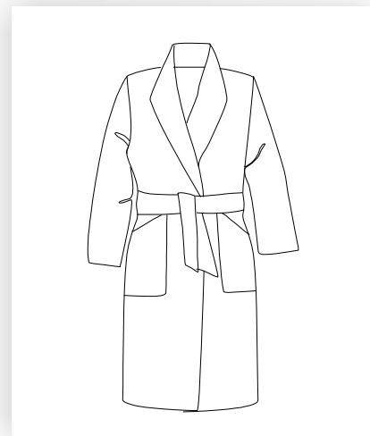
Mantel mit großem angeschnittenem Kragen zum Binden