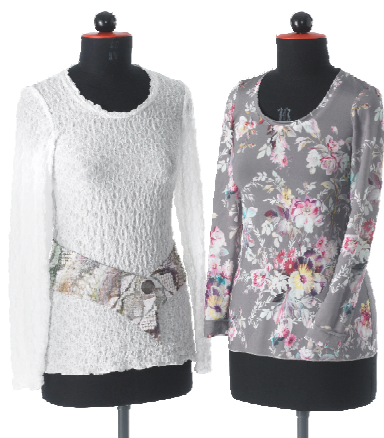
SHIRT 604 007