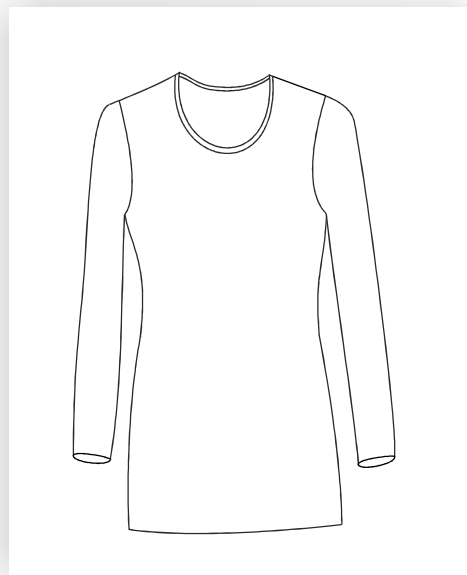
T-Shirt Klassiker mit langen Ärmeln und rundem Halsausschnitt.