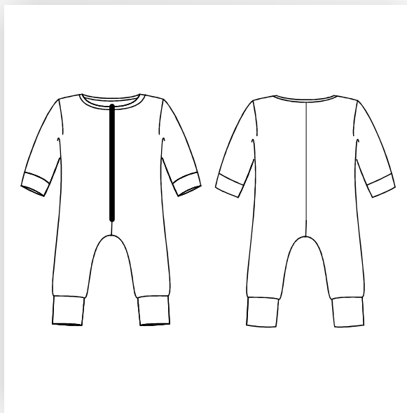
Strampelanzug mit langen Ärmeln.